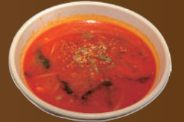
ユッケジャンスープ