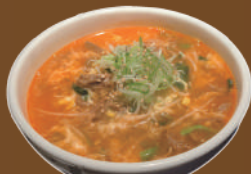
スタミナカルビラーメン