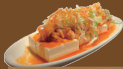
韓国風ピリ辛冷奴