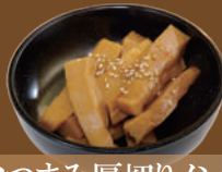
おつまみ厚切りメンマ