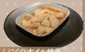
にんにくのオイル焼き