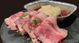
スタミナバターカルビ