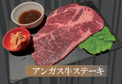
アンガス牛ステーキ