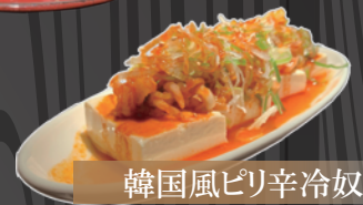
韓国風ピリ辛冷奴