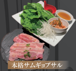
本格サムギョブサル

未就学児 無料 ドリンクバー 378円 (税込420円) 小学生 半額 未就学児無料 シニア(60歳以上) 500円引き アルコール飲み放題 1,454円 (税込1,600円)