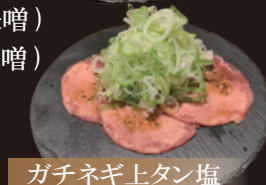
ガチネギ上タン塩