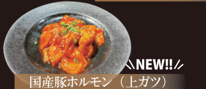
国産豚ホルモン(上ガツ)