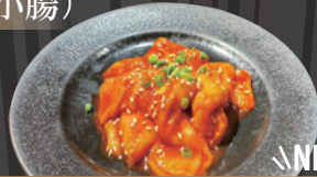
国産豚ホルモン(上ガツ)