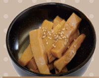
おつまみ厚切りメンマ