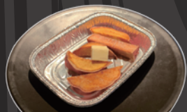
ホク旨おさつバター