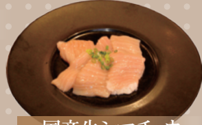
国産牛シマチョウ