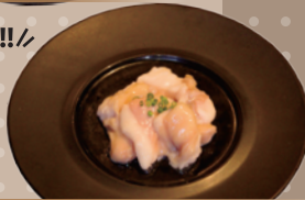
国産牛ホルモン (小腸)