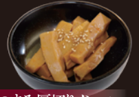
おつまみ厚切りメンマ