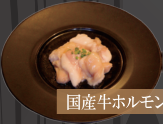
国産牛ホルモン(小腸)