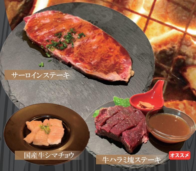
サーロインステーキ