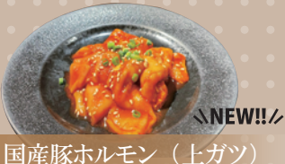
国産豚ホルモン (上ガツ)