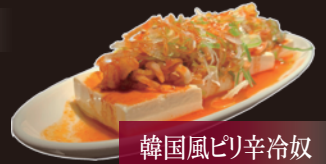
韓国風ピリ辛冷奴

白菜キムチ カクテキ きゅうりキムチ 揚げ海鮮チヂミ もやしナムル ホウレン草ナムル ポトフライ(旨塩・のり塩) 塩ネギ 韓国風ピリ辛冷奴 塩ネギ冷奴 うずらの味玉 チキンナゲット 焼肉トッピング(スタミナバター おろしポン酢) おつまみ厚切りメンマ